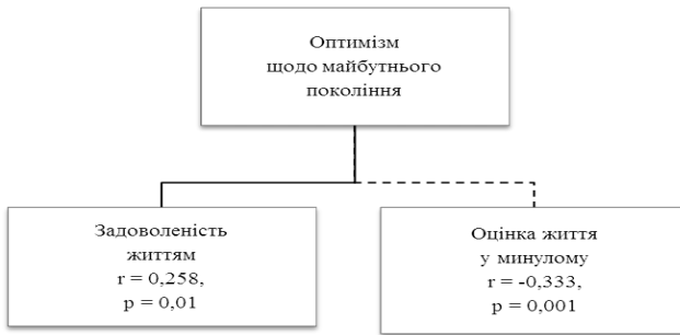
Рис. 1. Кореляційна плеяда оптимізму покоління та задоволеності життям

Респонденти задоволені особистим життям у минулому, меншою мірою оптимістично налаштовані щодо майбутнього своєї країни. Та особи задоволені своїм життям повною мірою виявляли вищий рівень оптимізму стосовно майбутнього країни (прямий, позитивний кореляційний зв'язок згаданих показників) ( r = 0,288 ; p = 0,01 ).