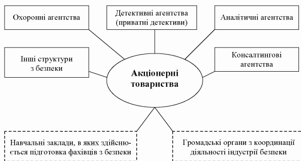
Рис. 1. Система недержавних структур безпеки

Виклад основних положень. За оцінками експертів у сфері охоронної діяльності України наразі зайнято сотні тисяч громадян [10], котрі працюють у недержавних структурах з безпеки, яких налічується понад 4 тисячі офіційно зареєстрованих [3]. Організацій, які можуть брати участь у забезпеченні економічної безпеки АТ, можна класифікувати за напрямками діяльності (рис. 1.).