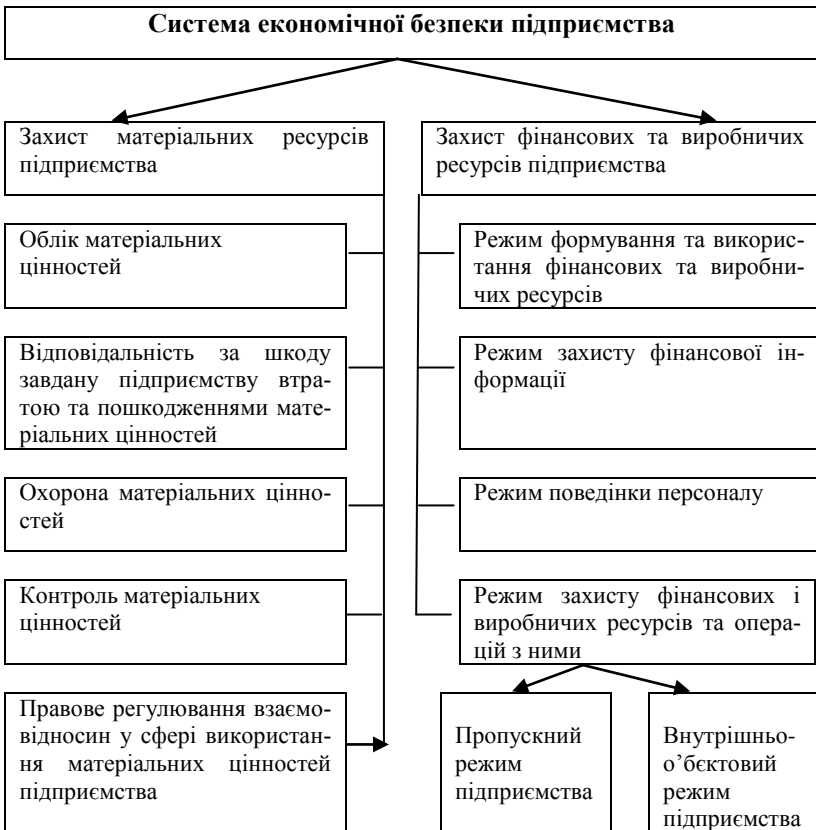
Рис. 1. Місце охоронної діяльності як інструменту фізичного захисту активів у системі економічної безпеки підприємства

Є ще третя функція – забезпечення особистої безпеки засновників та менеджменту підприємства шляхом здійснення їх особистої фізичної охорони [5], але ця функція не є предметом розгляду цієї статті.