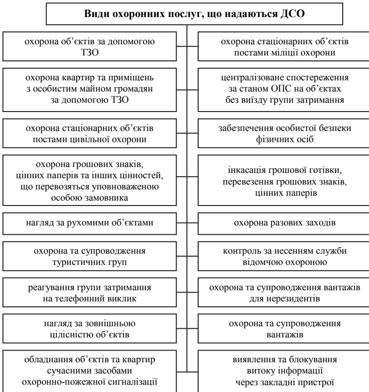
Рис. 1. Структура охоронних послуг, що надаються ДСО

Ще однією перевагою можна вважати державний статус ДСО, зокрема в контексті обміну відповідною інформацією при тісній взаємодії з регіональними підрозділами органів внутрішніх справ. Жодна з приватних структур безпеки такої сукупності повноважень, сил і засобів не має. Таким чином, роль ДСО на ринку охоронних послуг України обумовлена наявністю в її розпорядженні найбільш потужних сил і засобів, законодавчому захисті її діяльності, а також тим, що саме ДСО визначає «правила гри» на ринку охоронних послуг.