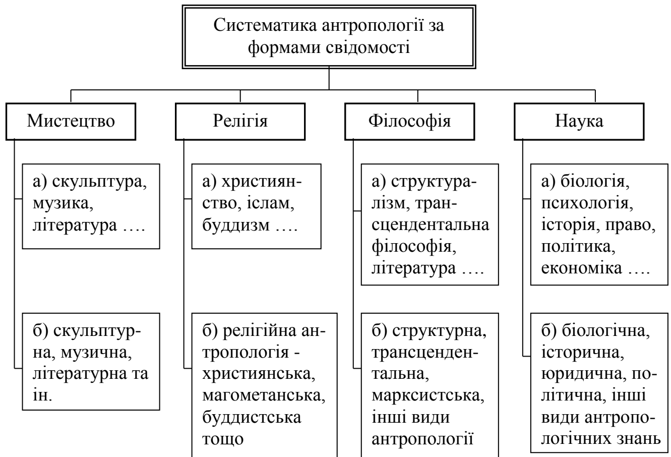
Рис. 1.2. Сучасна класифікація антропології за формами свідомості (складено за [164, с. 27-28])

І хоча, на перший погляд, видається, що кожен вид антропології має свої відмінні завдання, їх можна класифікувати за такими сферами діяльності людини (або свідомості), як мистецтво, релігія, філософія і наука (рис. 1.2).