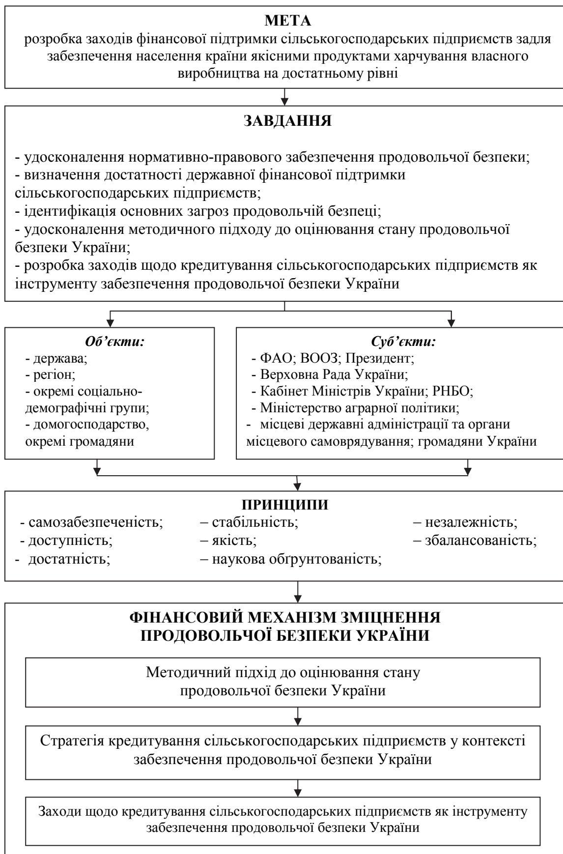
Рис. 3. Основні складові фінансового механізму зміцнення продовольчої безпеки України