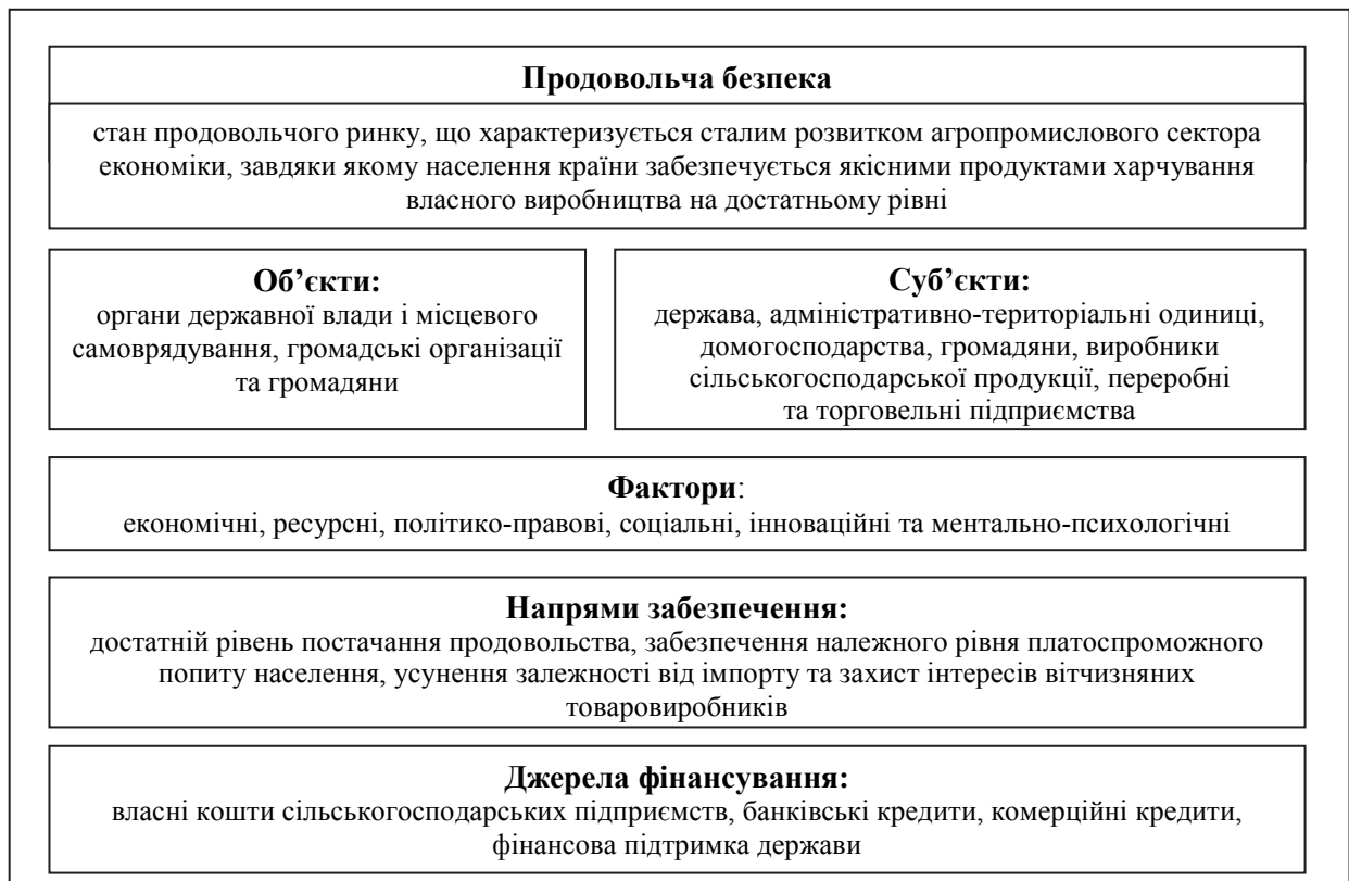
Рис. 1. Основні елементи системи продовольчої безпеки

Досліджено та виокремлено основні складові елементи системного підходу до вивчення продовольчої безпеки (рис. 1).