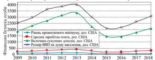
Рис. 1. Динаміка основних показників, що визначають рівень фінансової безпеки особи

Варто зауважити, що аналіз кожного показника із системи показників не дає цілісної картини та малопридатний для здійснення комплексної оцінки реального стану досліджуваного об'єкта і для здійснення міжрегіональних та міжнародних порівнянь, оскільки методологія розрахунку окремих показників у різних системах досить часто відрізняється. Тому на сьогодні дедалі більшої актуальності набувають питання побудови єдиного інтегрального показника, за яким визначали б рівень фінансової безпеки особи, застосування якого дало б змогу дати однозначну характеристику рівня та динаміки розвитку суспільства. Для розрахунку інтегрального показника всі дані, індикатори та індекси вимірюються за допомогою різних фізичних величин, мають різні інтерпретації та змінюються в різних діапазонах (Kharon, 2015). Тому ми їх пронормували так, що їх значення знаходилися в діапазоні від 0 до 1, перед тим розділивши на стимулятори та дестимулятори. Провівши відповідні розрахунки, отримали значення інтегрального індексу фінансової безпеки особи (рис. 2).