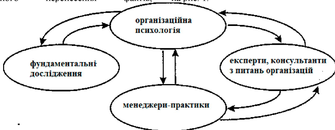
Рис. 1. Місце організаційної психології в системі «наука - практика» за А.М. Занковським

За А.М. Занковським [2] організаційна психологія виступає сполучною ланкою між фундаментальним знанням і реальною організаційною діяльністю. Побачити положення організаційної психології в системі «наука - практика» дозволяє запропонована ним схема, що представлена на рис. 1.