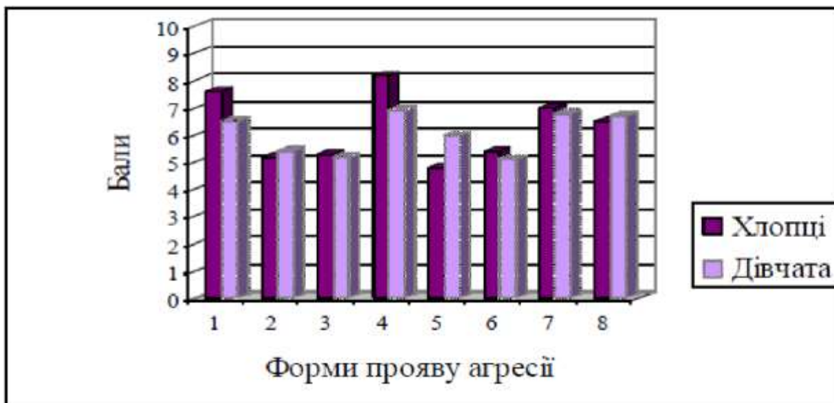
Рис. 2.2. Форми прояву агресії у хлопців та дівчат 12-13 років