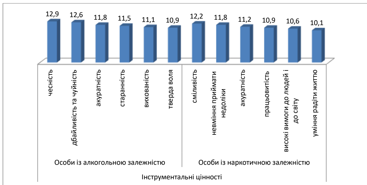
Рис.1. Результати дослідження інструментальних цінностей

На рисунку 2 візуально зображено результати домінуючих інструментальних цінностей (середнє значення).