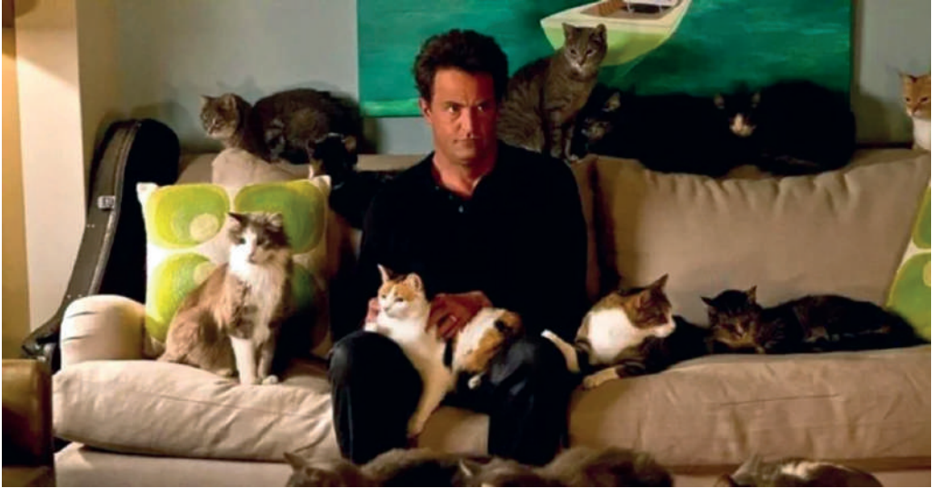
Рис. 1. Люди розказали, чи шкодують вони про те, що не стали батьками (інтернет ресурс) https://fishki.net/tag/chajldfri/

формування потреби у дітях на мікрорівні, адже соціально-демографічний портрет child-free виглядає досить привабливо.