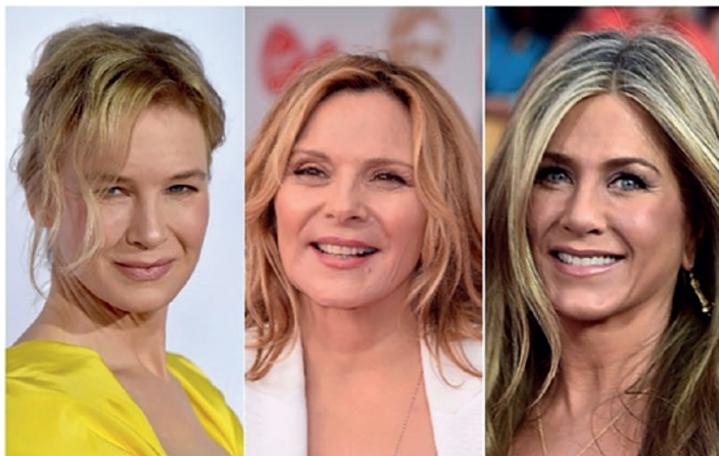
Рис 3. Знаменитості, які все ще не стали мамами (інтернет ресурс) https://www.google.com/search?q=Childfree