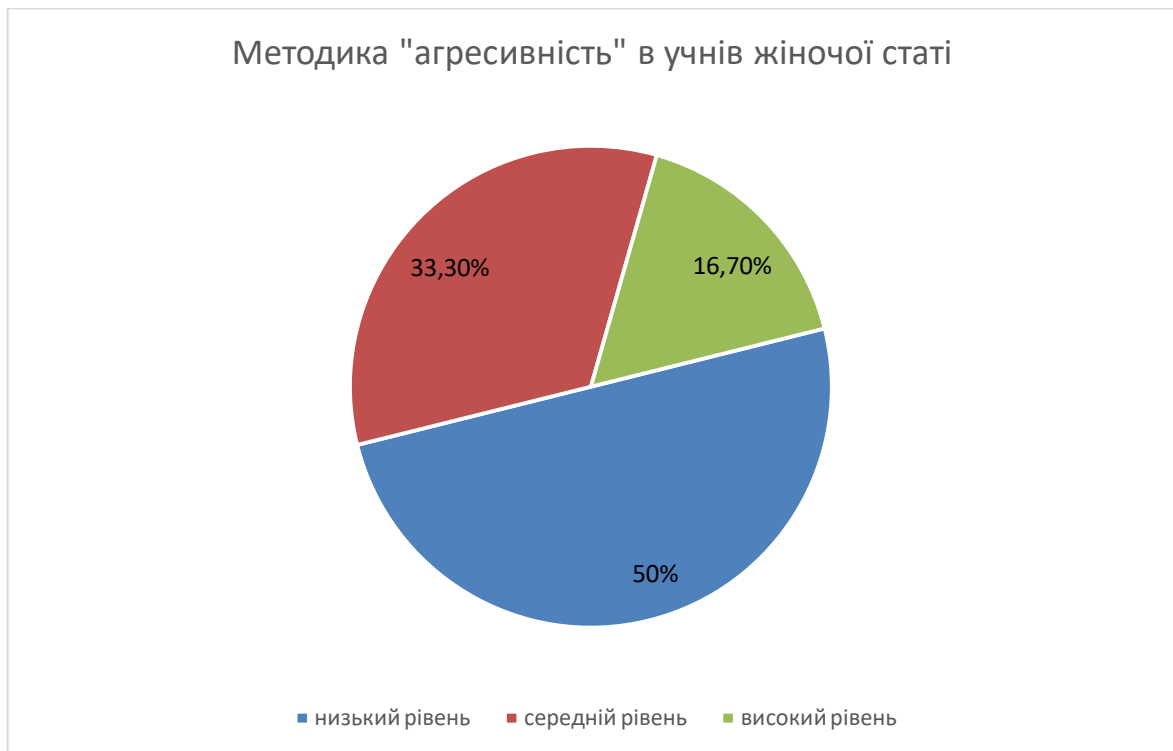
Рис.2.3. Результати за методикою «агресивність» дівчат-підлітків

Як бачимо на рис. 2.3. у 50% дівчат-підлітків виявлено низький рівень агресивності. У 33,3% дівчат нами зафіксовано середній рівень агресивності, у 16,7% -- високий рівень агресивності. Отже, більшість дівчат підліткового віку продемонстрували низький та середні рівні агресивності.