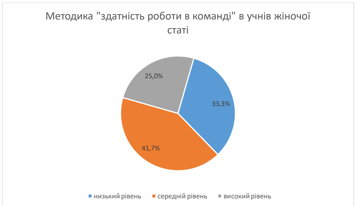
Рис. 2.6. Результати методики «здатність роботи в команді» в підлітків-дівчат

Аналізуючи діаграму на рис. 2.6., можемо побачити, що у 33,3% дівчат-підлітків зафіксовано низький рівень роботи в команді. Такі учні, як правило не приймають участь в командній роботі, не є командними гравцями. У 41,7% дівчат виявлено середній рівень командної роботи. Тобто, вони здатні до роботи в групі, але вони не є гнучкими у діяльності. І у 25 % дівчат-підлітків виявлено високий рівень роботи в групі. Це значить, що такі підлітки є контактні, дружелюбні, легкі у спілкуванні з людьми, командні гравці.