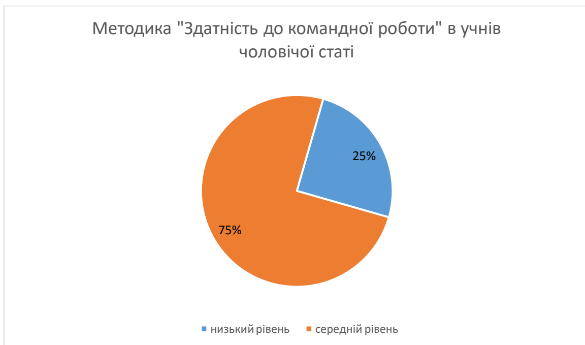
Рис. 2.5. Результати дослідження за методикою «здатність до командної роботи» в хлопців-підлітків

Результати тестування "Здатність до командної роботи" дозволили виявити соціально-психологічні особливості проявів підлітків під час роботи у команді та виявити відмінності цих проявів у дівчат та хлопців підліткового віку, які представлено на рис. 2.5. та рис. 2.6.