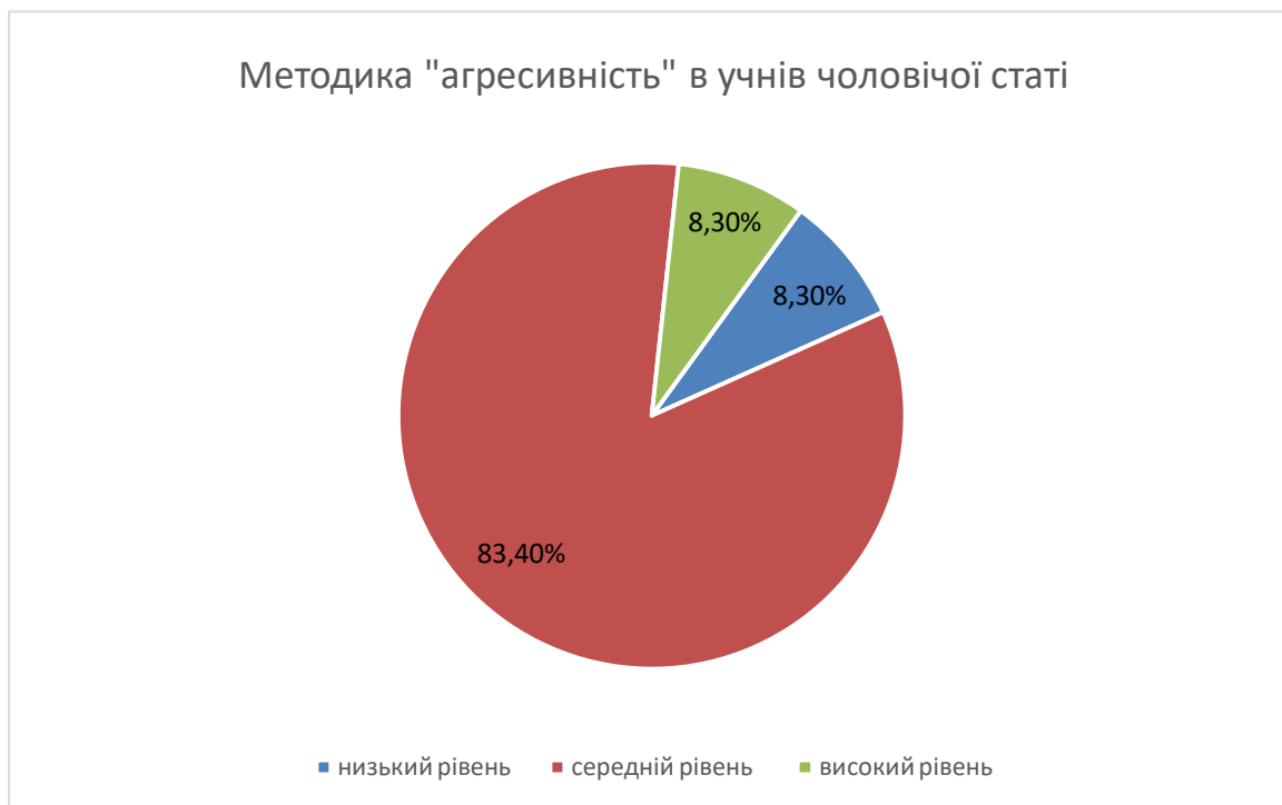
Рис.2.3. Результати за методикою «агресивність» хлопців-підлітків

0,27, при p \leq 0,05 ) та фізичною агресією ( r_s = - 0,29 , при p \leq 0,05 ) може свідчити про низьку самокритичність підлітків до власних агресивних дій, скоєних по відношенню до інших.