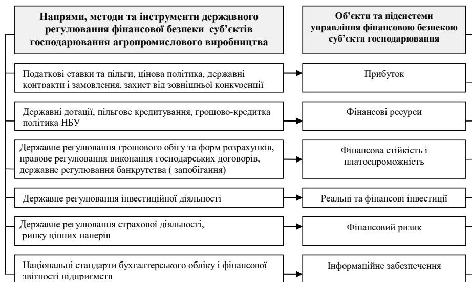
Рис. 1. Система державного регулювання фінансової безпеки суб'єктів господарювання агропромислового виробництва

Дисертант виходить з того, що досягнення належного рівня фінансової безпеки передбачає формування та функціонування відповідної системи управління. Під управлінням фінансовою безпекою агропромислового виробництва доцільно розуміти вплив державних інститутів через відповідні методи на фінансовий стан і фінансові результати суб'єктів господарювання агропромислового виробництва ( рис. 1 ), а також господарське управління фінансовою безпекою на рівні його окремих господарюючих суб'єктів.