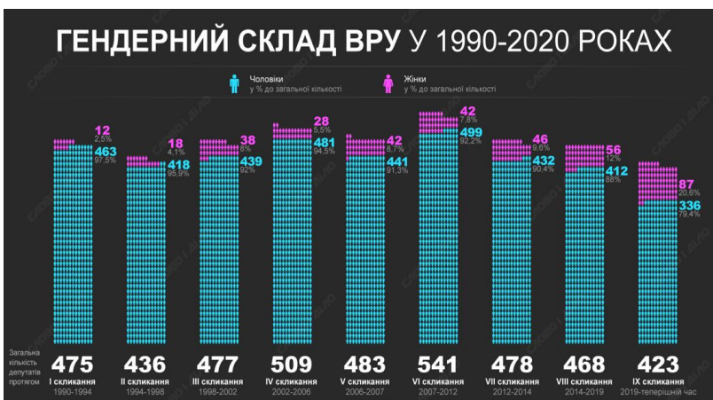
Рис. 3. Частка місць жінок у Верховній Раді України по скликаннях

В першому скликанні Верховної Ради України було тільки 2,5% жінок (12 з 475 депутатів), в скликанні 2019 року – 20,6% (87 з 423 нардепів). У другому скликанні Ради жінки становили 4,1% всього складу (18 з 436 депутатів), в третьому – 8% (38 з 477), в четвертому – 5,5% (28 з 509), в п'ятому – 8,7% (42 з 483), в шостому – 7,8% (42 з 541), в сьомому – 9,6% (46 з 478), у восьмому – 12% (56 з 468) [2].