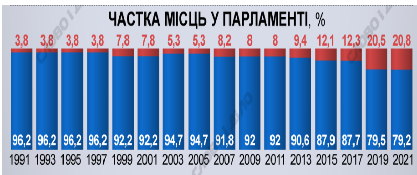
Рис. 2. Частка місць жінок у Верховній Раді України по роках

В першому скликанні Верховної Ради України було тільки 2,5% жінок (12 з 475 депутатів), в скликанні 2019 року – 20,6% (87 з 423 нардепів). У другому скликанні Ради жінки становили 4,1% всього складу (18 з 436 депутатів), в третьому – 8% (38 з 477), в четвертому – 5,5% (28 з 509), в п'ятому – 8,7% (42 з 483), в шостому – 7,8% (42 з 541), в сьомому – 9,6% (46 з 478), у восьмому – 12% (56 з 468) [2].