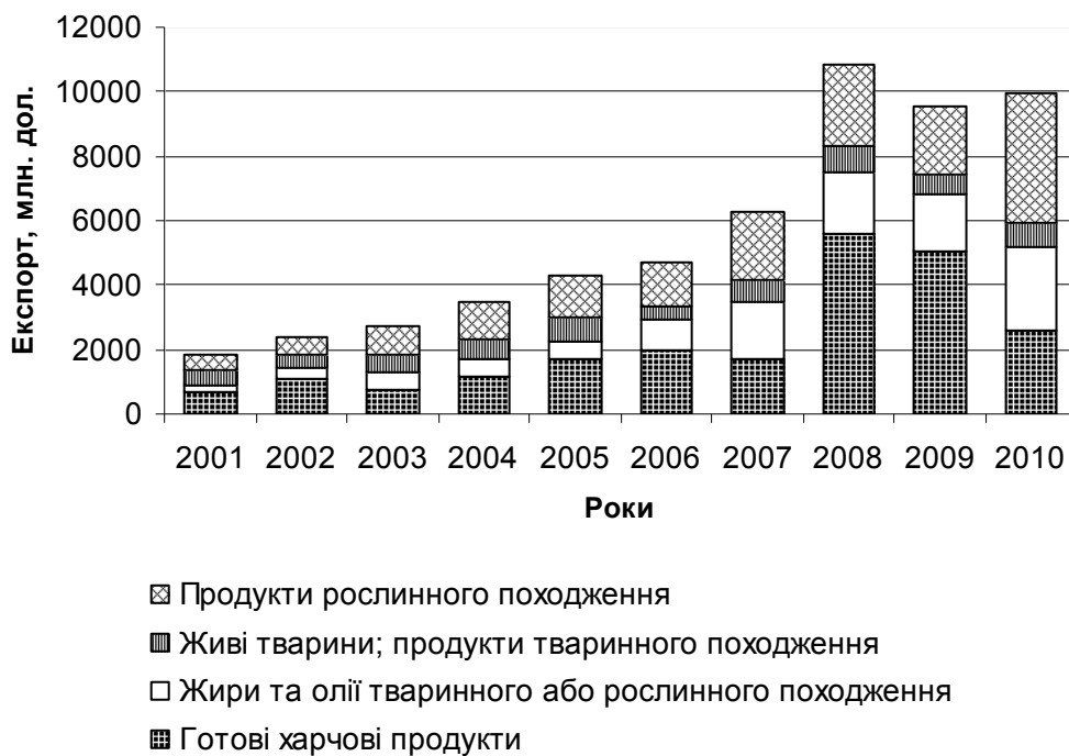
Рис. 1. Динаміка і структура експорту сільськогосподарської продукції та продуктів її переробки в Україні (розраховано і складено на основі [5])

Тривожним фактом щодо зовнішньоекономічної діяльності агропромислового сектора України є, передусім, те, що якщо у вітчизняному сільськогосподарському експорті переважає продукція з низьким рівнем обробки та низькою доданою вартістю, то в імпортних надходженнях ситуація протилежна (рис. 2). Це ще раз ілюструє проблему низької конкурентоспроможності та нерозвиненості обробної промисловості України, що спричиняє сировинну орієнтацію вітчизняного експорту у сільськогосподарському секторі та необхідність імпорту готової продукції, яка фактично могла б потенційно вироблятися в Україні та експортуватися у інші країни.