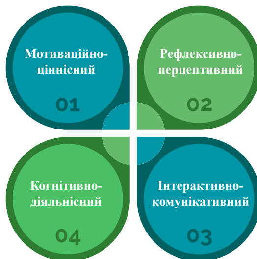
Рисунок 1. Компоненти підготовленості майбутніх соціальних педагогів

Виконання цих завдань потребує підготовки висококваліфікованих фахівців, розвитку їхнього особистісного потенціалу, процесу творчого саморозвитку. У структурі підготовленості майбутніх соціальних педагогів до професійної діяльності у закладах соціального захисту дітей В. Леонова виокремлює такі компоненти (рис. 1) [12].