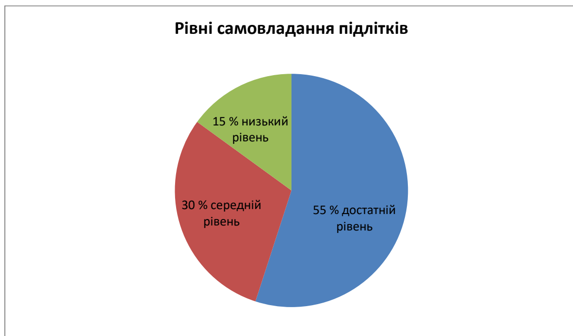
Рис. 2.1. Особливості саморегуляції підлітків

У результаті тестування ми отримали такі показники: приблизно половина з 77 підлітків (55%) продемонстрували достатній рівень самоконтролю; середній – близько 30%; низький – близько 15% респондентів, див. рис. 2.1.