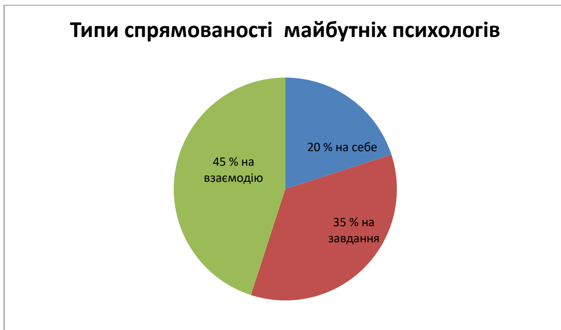
Рис. 2.2. Типи спрямованості майбутніх психологів

Аналіз показників дослідження за методикою «Спрямованість особистості студента» (адапт. І. Попович) дозволила отримати наступні результати (див. рис. 2.2).