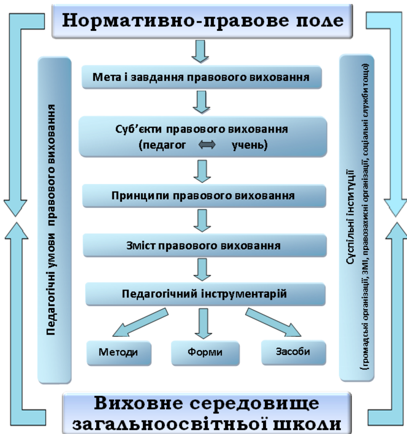
Рис. 2.2.. Модель правового виховання старшокласників у виховній роботі сучасної школи