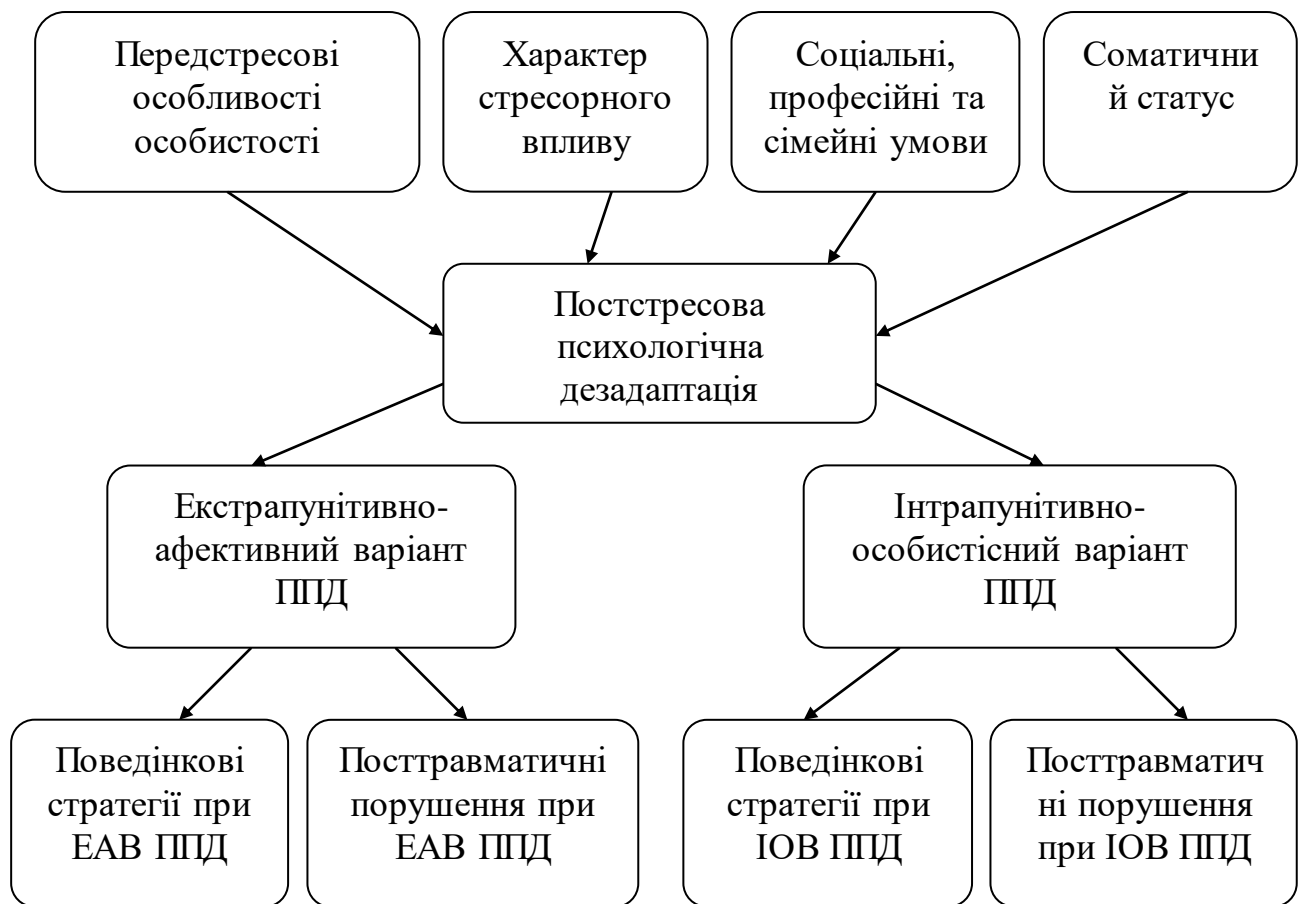
Рис. 6.1. Схема формування ППД

структурою, яка продукує явища психологічної дезадаптації є набуті під час участі в АТО нові поведінкові стратегії (патерни). Зважаючи на те, що навчання та засвоєння нових поведінкових стратегій проходило в умовах перманентного психологічного і соматичного стресу, наявності реальної вітальної загрози та відповідало новим умовам життєдіяльності особистості, ці стратегії носять актуальний, з високим рівнем емоційно-афективного супроводу, характер. Вони підтвержені успішним досвідом їх застосування в умовах бойових дій та дозволили особистості успішно функціонувати та вижити в цих умовах. Можна сказати, що в результаті участі в АТО особистість набула, актуального для неї, досвіду та одержала додаткові інструменти для більш успішної життєдіяльності. І це має однозначну позитивну оцінку учасників з обома варіантами дезадаптації. Схематично механізми формування ППД відображені на малюнку 6.1.