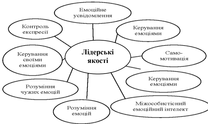
Рис. 1. Кореляційні зв'язки за шкалою «Лідерські якості»

Згідно з результатами кореляційного аналізу можна зробити висновки: що більшим є емоційне усвідомлення ( r = 0,5 при p < 0,05 ), керування емоціями ( r = 0,5 при p < 0,05 ), самомотивація ( r = 0,5 при p < 0,05 ), керування емоціями інших ( r = 0,6 при p < 0,05 ), міжособистісний інтелект ( r = 0,4 при p < 0,05 ), розуміння емоцій ( r = 0,3 при p < 0,05 ), розуміння чужих емоцій ( r = 0,4 при p < 0,05 ), керування власними емоціями ( r = 0,3 при p < 0,05 ) та контроль експресії ( r = 0,3 при p < 0,05 ), то вищий показник лідерських якостей спостерігатиметься у студентів (рис. 1).