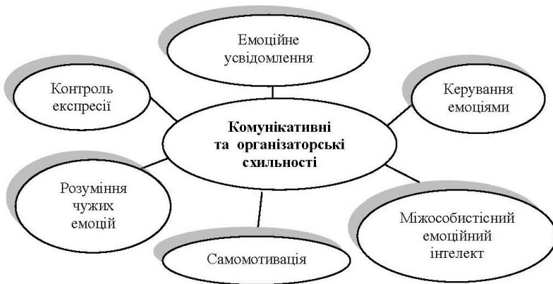
Рис. 2. Кореляційні зв'язки за шкалою «комунікативні та організаторські схильності»

Отримані результати свідчать також про те що, чим більшим є емоційне усвідомлення ( r = 0,5 при p < 0,05 ), керування емоціями ( r = 0,5 при p < 0,05 ), самомотивація ( r = 0,5 при p < 0,05 ), міжособистісний інтелект ( r = 0,4 при p < 0,05 ), розуміння емоцій ( r = 0,3 при p < 0,05 ), розуміння чужих емоцій ( r = 0,4 при p < 0,05 ) та контроль експресії ( r = 0,3 при p < 0,05 ), то вищий спостерігатиметься показник комунікативних й організаторських схильностей у молодих спеціалістів (рис. 2).