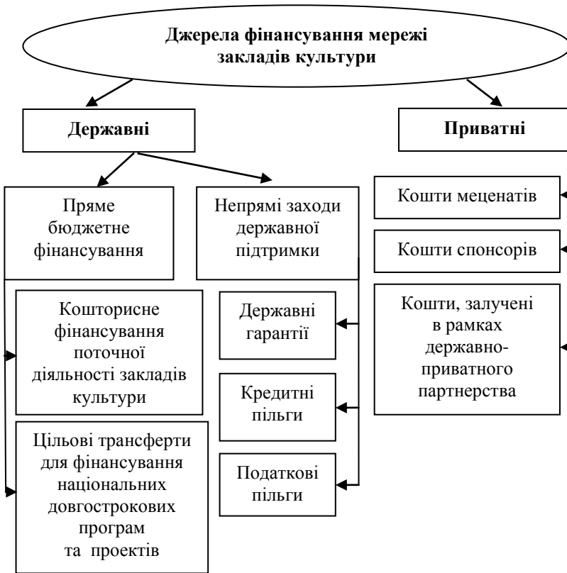
Рис. 3. Джерела фінансування сфери культури в Україні

Фінансування сфери культури в Україні віднедавна за «залишковим» принципом стало очевидним наслідком складної економічної ситуації в державі, військовим конфліктом на сході країни, що спричинило обмеженість бюджетних ресурсів і їх концентрацію на фінансуванні безпеки держави.