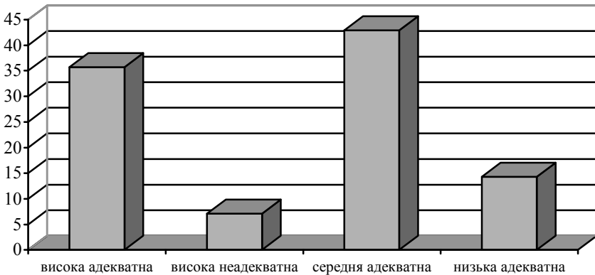
Рис. 2. Розподіл рівнів самооцінки професійних якостей майбутніми психологами

недостатню обізнаність респондентів з власними якостями та поведінковими проявами, які визначають успішність професійної самореалізації. Це, своєю чергою, детермінує потребу у створенні у процесі навчання таких умов, які б забезпечили не тільки когнітивний аспект професіоналізації, але й давали змогу підвищити рівень мотиваційно-ціннісних установок майбутніх психологів, їх спрямованість на професійне зростання завдяки розвитку особистісного потенціалу. Показово, що у цієї групи респондентів домінує середній рівень рефлексивності (66,7%). Отже, потреба у самоосмисленні повинна бути реалізована у процесі набуття професійних умінь і навичок.