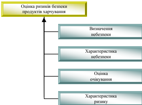
Рис. 1. Етапи оцінки ризиків продуктів харчування

Обвальне падіння власного виробництва сільськогосподарської продукції спричинило збільшення завезень в Україну товарів іноземного виробництва, причому досить низької якості, що й спричинило різке зниження рівня продовольчої безпеки та зниження показника екологічності продовольчих ресурсів. Слід зазначити, що поліпшення якості й біологічної цінності сільськогосподарської продукції є одним з головних завдань агропромислового комплексу, та продовольчої політики кожної держави. З цією метою у країнах Євросоюзу створено систему швидкого реагування у сфері продовольства й харчування (RASFF), метою якої є гарантування безпеки продуктів харчування. RASFF є інструментом, який уможлиблює швидкий та ефективний обмін інформацією між країнами членами та Єврокомісією у випадку виявлення в продуктах та системі громадського харчування ризиків, небезпечних для здоров'я людини, а саме: надто високий вміст патогенних мікроорганізмів, алергенів, важких металів, микотоксинів тощо. Оцінка ризиків безпеки продуктів харчування повинна складись з наступних етапів (рис. 1) і включати оцінку харчових добавок, залишків ветеринарних препаратів та пестицидів, мікробіологічних ризиків, а також процесів, включно з харчовими продуктами, отриманих за допомогою біотехнологій.