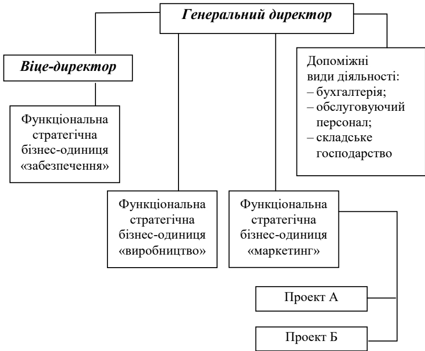
Рис. 1. Удосконалена внутрішня організаційна структура ТОВ «Пома»

Цей спосіб подолання негативних наслідків надмірного діапазону управління керівника вищого рівня має свої сильні та слабкі сторони.