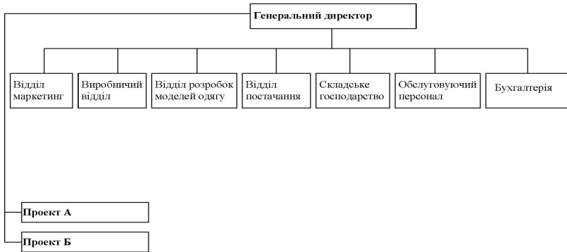
Рис. 4. Удосконалена внутрішня організаційна структура ТОВ «Пома» (остаточний варіант)

Поєднавши модифіковані організаційні структури за варіантами 1, 2, 3, отримаємо остаточний варіант удосконаленої внутрішньої організаційної структури ТОВ «Пома», схема якої зображена на рис. 4.