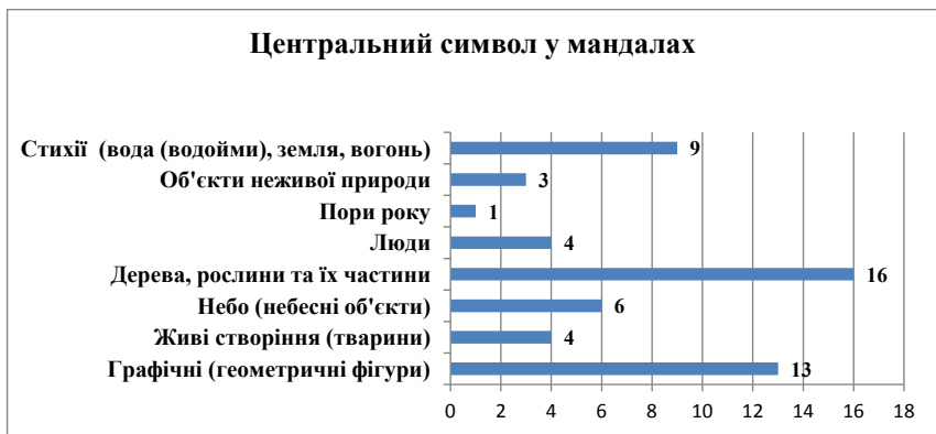
Рис. 2. Розподіл центральних символів у мандалах