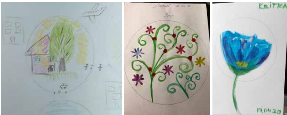
Рис. 3. Символи у мандалах категорії «Деревя, квіти та їх частини»