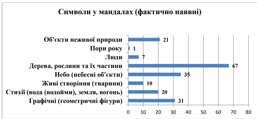
Рис. 1. Розподіл символів у мандалах (фактично наявні)

як ригідність та егоцентризм, проявами яких можуть бути впевненість і стійкість, а також жорсткість, коло може вказати на рівновагу, порядок, проте певну зацикленість, статичність, а квадрат часто демонструє організованість, ригідність, органічність, конструктивність, владу, всемогутність і водночас простоту, прямоту, твердість, незворушність, прямодушність, чесність, щирість, моральність, честь автора такого малюнку мандалі (рис. 4).