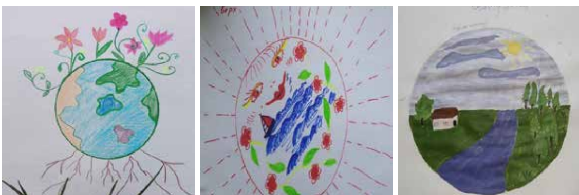
Рис. 5. Символи у мандалах категорії «Стихії»

Символіка стихій (землі, води, вогню) є свідченням усвідомлення та цінності усіх життєвих процесів. Так, переважання в малюнках символу землі вказує на наявність або потребу в почутті безпеки, опори, стабільності та впевненості у собі. Оскільки ситуація пандемії «вибила землю з під ніг» практично у кожного, очевидно є висока частота появи цього символу в малюнках.