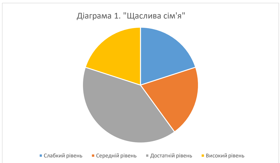
Рис.1. Даграма «Щаслива сім'я»

Результати ми подали у вигляді діаграм. Для проведення даного дослідження було опитано 10 респондентів віком 7-10 років.