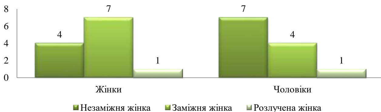
Рис. 2.1. Гендерна специфіка побудови ієрархії шлюбно-сімейних статусів жінок

нашу думку, підтверджує наявність у українських жінок орієнтації на патріархальні цінності.