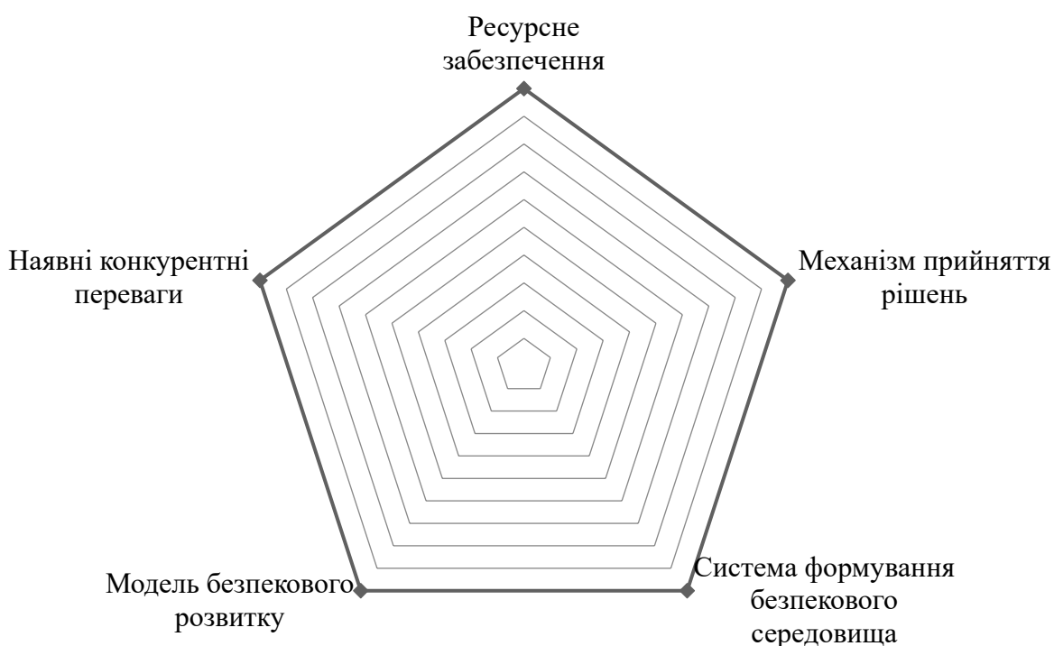
Рис.1. Ключові фактори, що впливають на забезпечення економічної безпеки в рамках підвищення ефективності конкурентоспроможності

Коли приймається будь-яке управлінське рішення, або ж здійснюється реалізація заходів для підвищення того чи іншого показника, не обов'язково якісного, задіюється певний обсяг ресурсів [6-8]. Ресурси соціально-економічної системи бувають різні і їх по-різному класифікують. Безпека – це особливий стан, який постійно так би мовити «їсть» ресурси підприємства. Формування та реалізація безпекових механізмів – це, в першу чергу, ресурсні витрати для того, щоб бути максимально конкурентоспроможним на ринку. Витрати ресурсів на цей процес сильно залежать від масштабування середовища. Якщо ми говоримо про внутрішній ринок, тут йдуть одні ресурси, а коли є вихід на міжнародний ринок – це вже зовсім інший обсяг ресурсів. Жодна конкурентна боротьба не можлива без ресурсів [9-12]. Саме тому, ресурсне забезпечення відіграє ключову роль в рамках забезпечення економічної безпеки будь-якої соціально-економічної системи в умовах підвищення її конкурентоспроможності (рис.1).