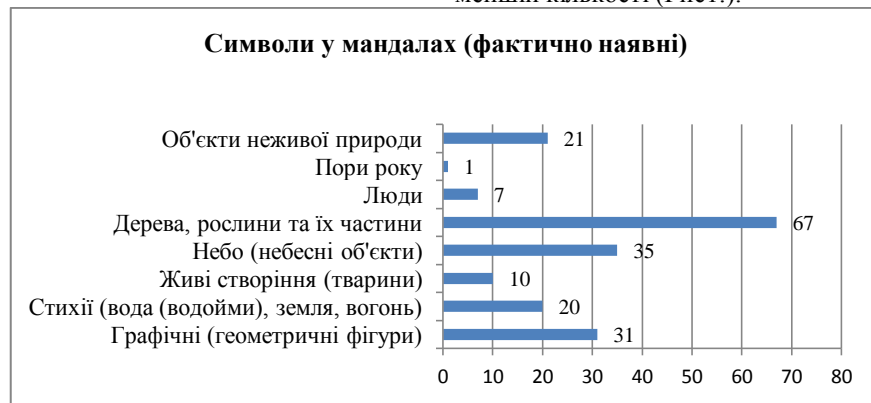
Рис.1. Показники символів у мандалах (фактично наявні).

З давніх-давен коло було символом циклу життя. Мандала – це коло, складна геометрія, в якій закодовано глибокий духовний зміст. Мандала символізує сферу, навколишнє середовище, є відображенням природи. Малювання мандали використовується як засіб спрямувати розум і вселити спокій у внутрішній світ. Тому не дивно, що у результаті якісної обробки отриманих малюнків мандал виявлено, що домінуючими символами у мандалах є дерева, рослини та їх частини, тобто ботаноморфні символи. Інші символи, такі, як графічні та геометричні фігури, небо (небесні об'єкти) та об'єкти неживої природи, люди та пори року представлені у меншій кількості (Рис1.).