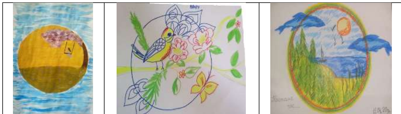
Рис.3. Ботаноморфні символи у мандалах.

Символ і образ у психічному відображенні дуже залежні від часу і терену. Інтерпретуючи групу ботаноморфних символів та асоціації з ними, для всіх респон-