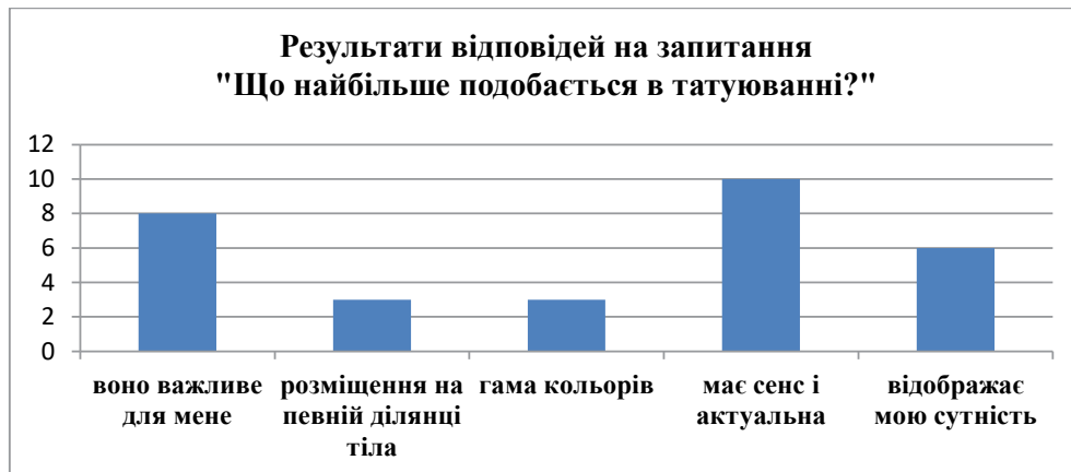
Рис. 6. Результати відповідей на запитання «Що найбільше подобається у татуюванні?»

Результати аналізу відповідей тату-майстрів під час проведеної бесіди з ними засвідчують, що у чоловіків більш серйозний підхід до змісту татуювання, а жінки більше переживають за його естетичний вигляд і сприймають зазвичай як аксесуар, що повинен привертати увагу або ж підкреслювати красу. Кожне із нанесених татуювання завжди впливає на позитивний настрій особи, навіть якщо його нанесення пов'язано із білью.