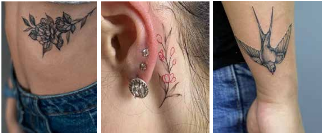
Рис. 2. «Жіночі» татування