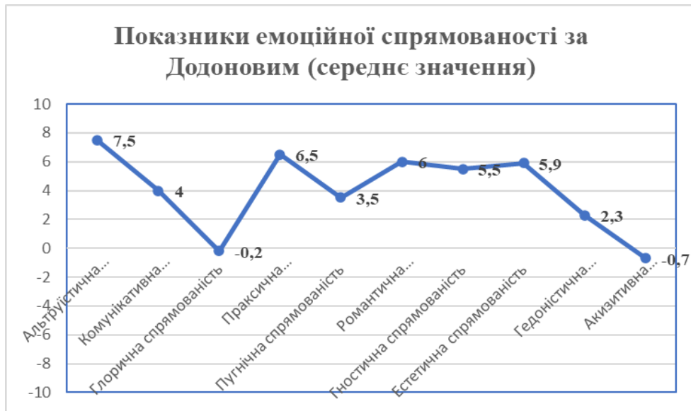
Рис. 7. Показники емоційної спрямованості