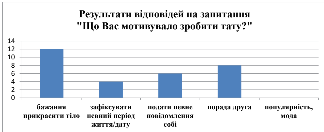
Рис. 4. Результати відповідей на запитання «Що Вас мотивувало зробити тату?»