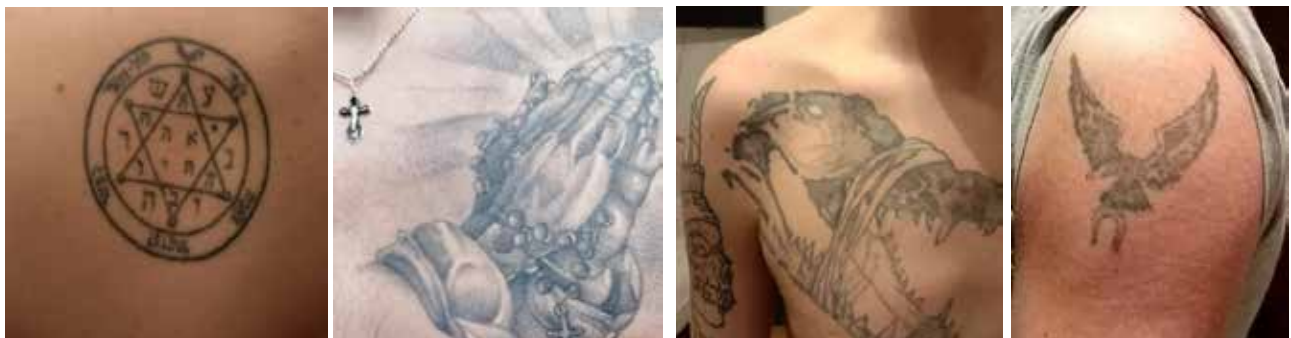
Рис. 3. «Чоловічі» татування

татуваннях найчастіше зустрічаються вищезгадані символи квітів, птахів, метеликів, які підтверджують жіночність, емоційність, чуттєвість, переживання. Зазвичай, такими зображення дівчата намагаються акцентувати увагу на певних частинах тіла, підкреслюючи їх, проте варто зазначити, що такі зображення однозначно характеризуються естетикою, витонченістю та емоційним наповненням (рис. 2).