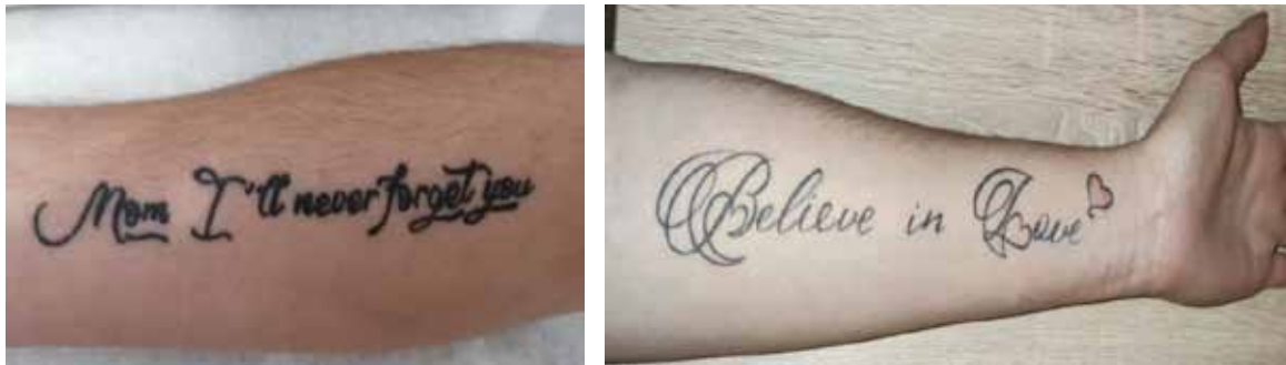
Рис. 1. Тату, пов'язані із емоційно значимими подіями