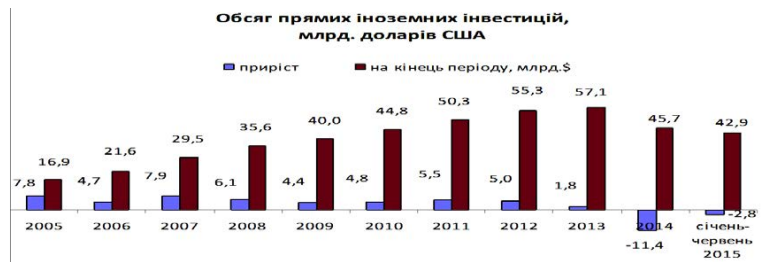
Рис. 3. Динаміка обсягу прямих іноземних інвестицій в економіку України, 2005-2015 рр. [6]

Такі зміни не приносять позитивних результатів, а навпаки стимулюють розвиток тіньового сектору економіки, який має негативну тенденцію до зростання, оскільки за останній рік темпи росту тіньової економіки піднялися до 40% [3]. З метою виходу з такої ситуації Україні варто започаткувати досвід західноєвропейських країн та країн-азійських тигрів (Японія, Сінгапур, Гонконг), де була значно звужена сфера бюджетного перерозподілу грошових потоків.