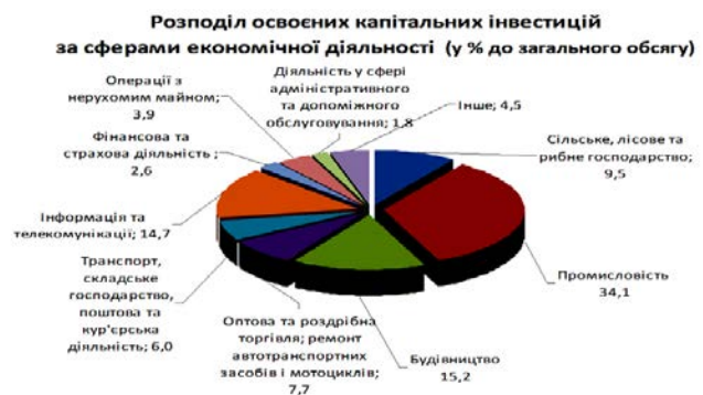
Рис. 4. Розподіл капітальних інвестицій за сферами економічної діяльності України у 2015 р. [6]

Не менш вагомою умовою політики дерегуляції є мінімізація безконтрольного проведення перевірок-рейдів з боку чиновників, що є прямим порушенням нововведених законодавчих норм [10]. Реформування системи державного контролю відбувається вкрай складно, адже ця система є однією з найбільш корумпованих, розгалужених та багатовекторних [11]. Необхідно зазначити, що політика дерегуляції може мати негативні наслідки як для соціальних верств населення так і для самих виробників, оскільки неконтрольоване підвищення цін може сильно позначитись на купівельній спроможності громадян [12].