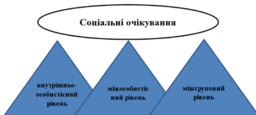
Рис. 1. Соціальні очікування: рівні функціонування

Психологічний захист у контексті соціальних очікувань має два вектори соціальної взаємодії: конструктивний та деструктивний. Перший, вочевидь, виявляється у конструктивних соціальних очікуваннях і прагне змінити ситуацію на краще або бодай не нашкодити. Другий тяжіє до руйнування ситуації з деструктивним, руйнівним прогнозом.