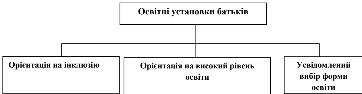
Рис. 2.2 Зміст освітніх батьківських установок

як зі сторони органів місцевої влади або шкільних (чи дошкільних) установ, так і з сторони близьких людей.