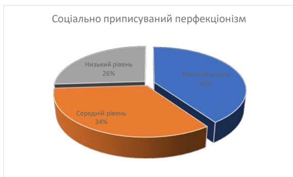
Рис. 3. Результати дослідження соціально орієнтованого перфекціонізму за методикою «Багатовимірна шкала перфекціонізму» П. Х'юїта–Г. Флетта

На рисунку 3 зображено результати дослідження показника «соціально приписуваний перфекціонізм» за методикою «Багатовимірна шкала перфекціонізму» П. Х'юїта–Г. Флетта. На рисунку бачимо, що у 40% досліджуваних викладачів виявлено високий рівень соціально приписуваного перфекціонізму, середній рівень спостерігається у 34% та низький рівень – у 26% досліджуваних викладачів.