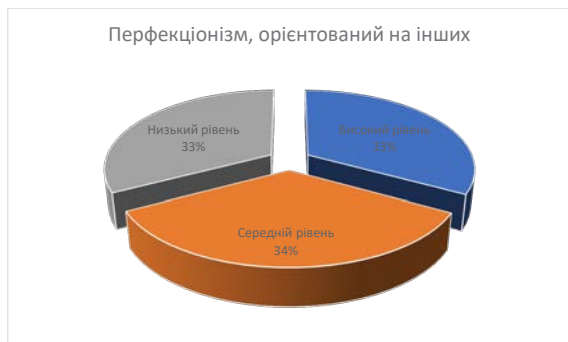
Рис. 2. Результати дослідження перфекціонізму, орієнтованого на інших, за методикою «Багатовимірна шкала перфекціонізму» П. Х'юїта–Г. Флетта

На рисунку 2 подано результати дослідження показника «перфекціонізм, орієнтований на інших» за методикою «Багатовимірна шкала перфекціонізму» П. Х'юїта–Г. Флетта. Як бачимо, високий рівень перфекціонізму, спрямованого на інших, притаманний 33% викладачів, середній – 34% та низький – 33% досліджуваних викладачів.