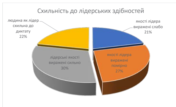
Рис. 4. Результати дослідження лідерських здібностей за методикою «Діагностика лідерських здібностей» Є. Жарікова – Є. Крушельницького

На рисунку 4 подано результати дослідження лідерських здібностей за допомогою методики «Діагностика лідерських здібностей» Є. Жарікова–Є. Крушельницького. Як бачимо, у 30% досліджуваних сильно виражені лідерські якості, у 27% – помірно, у 21% – слабо, а у 22% досліджуваних виявлено схильність до диктатури.