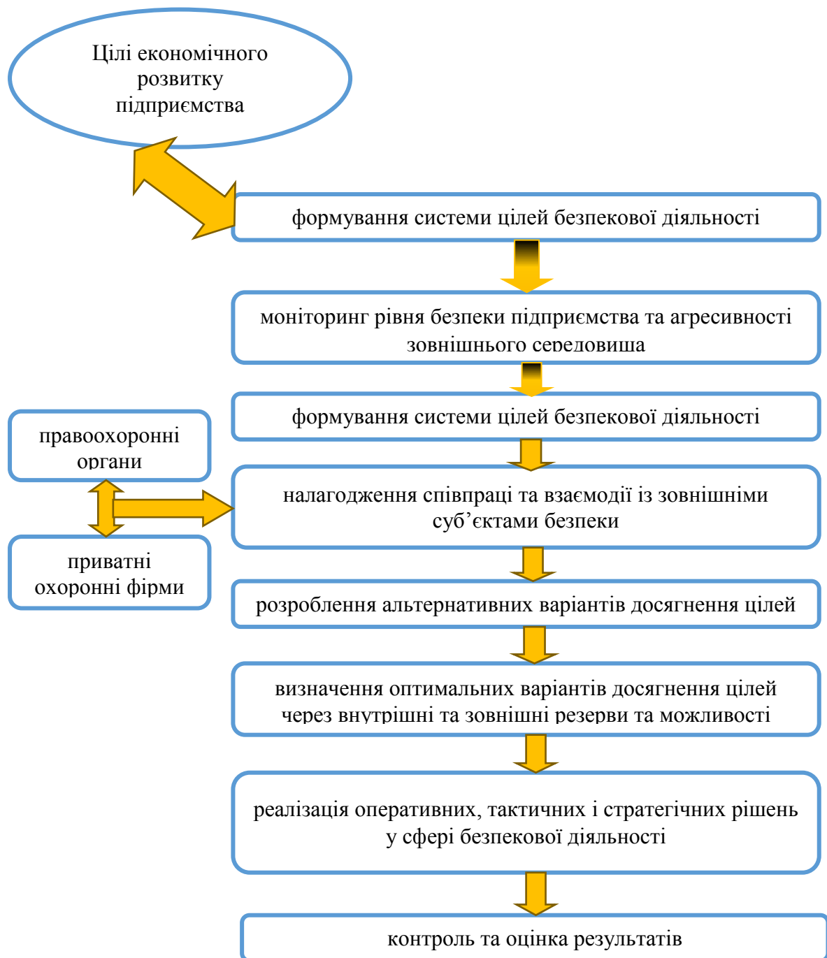
Рис. 1.1. Етапи формування моделі безпекової діяльності підприємства

Перейдемо до розробки алгоритму формування теоретичної моделі безпекової діяльності підприємства. Згаданий алгоритм представлено на рисунку 1.1.