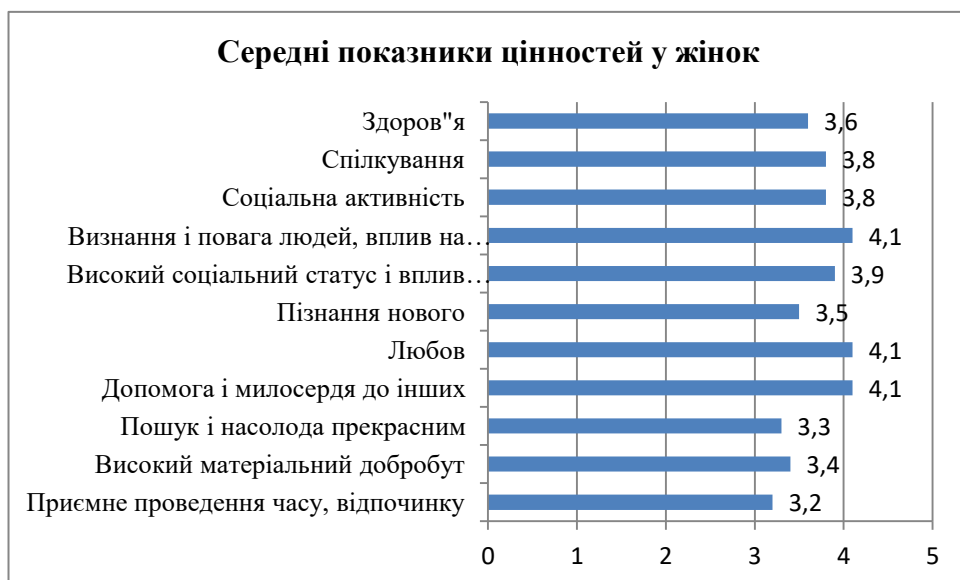
Рис.3. Показники цінностей у жінок

За результатами підрахунку цінностей визначено наступні середні показники (Рис.3)