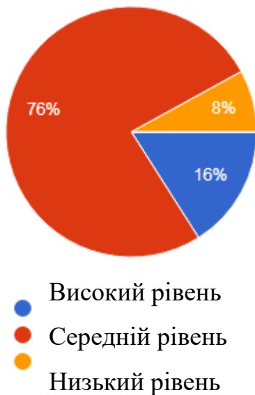
Рис. 2. 1. Психологічна готовність дітей до навчання у школі у %

Отже, аналіз результатів показав, що не всі діти виявили високий рівень готовності до навчання в школі. Значна частина дітей ще не досягла соціальної зрілості і потребує комплексної психолого-педагогічної підтримки із боку вчителя, психолога, та батьків, а також корекційних заходів для розвитку соціально-психологічного компоненту готовності до навчання.