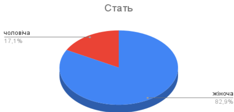
Рис. 2.1.1 Кількість досліджуваних за статтю

У дослідженні взяли участь 35 студентів, а саме 29 дівчат та 6 хлопців, які добровільно погодилися заповнити анкету та пройти тестування (див. рис.2.1.1)