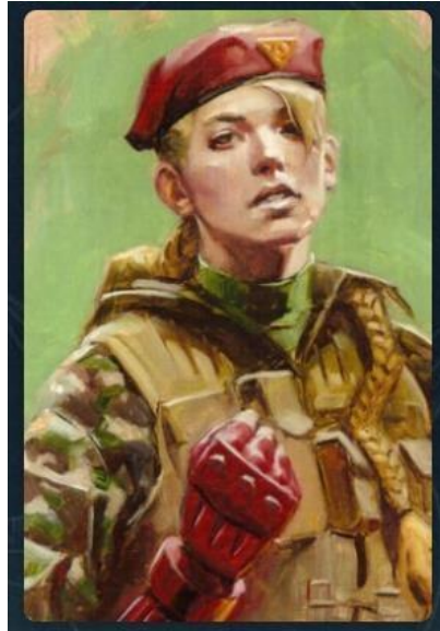
Рис.2.2. Картка з колоди «Образ Жінки»

Найпоширеніші карти, які обирали учасники вибірки: