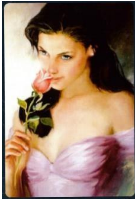
Рис.2.3. Картка з колоди «Образ Жінки»

одній руці дві валізи та дитину думала про те що моя рука також сталева», «Я самостійна, відкрита, чиста».