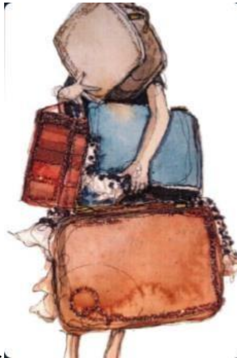
Рис.2.4. Картка з колоди «Образ Жінки»

Отже, ця картка може приваблювати жінок із високим рівнем фемінності через їхню здатність до сприйняття та цінування краси, романтики та емоційного багатства. Вони можуть відчувати себе підтримані та впізнавати себе в такому образі, що відображає їхні власні цінності та уподобання. Ось деякі описи досліджуваними цієї картки «Це однозначно я! – мрійлива, легка та дуже романтична», «Ця дівчинка може і не дуже актуальна я, але це точно до чого я прагну!».