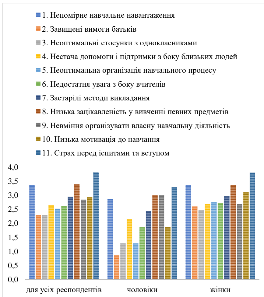
Рис. 2. Чинники виникнення шкільної тривожності, у балах

Також було проведено опитування стосовно чинників виникнення шкільної тривожності (див. рис. 2).