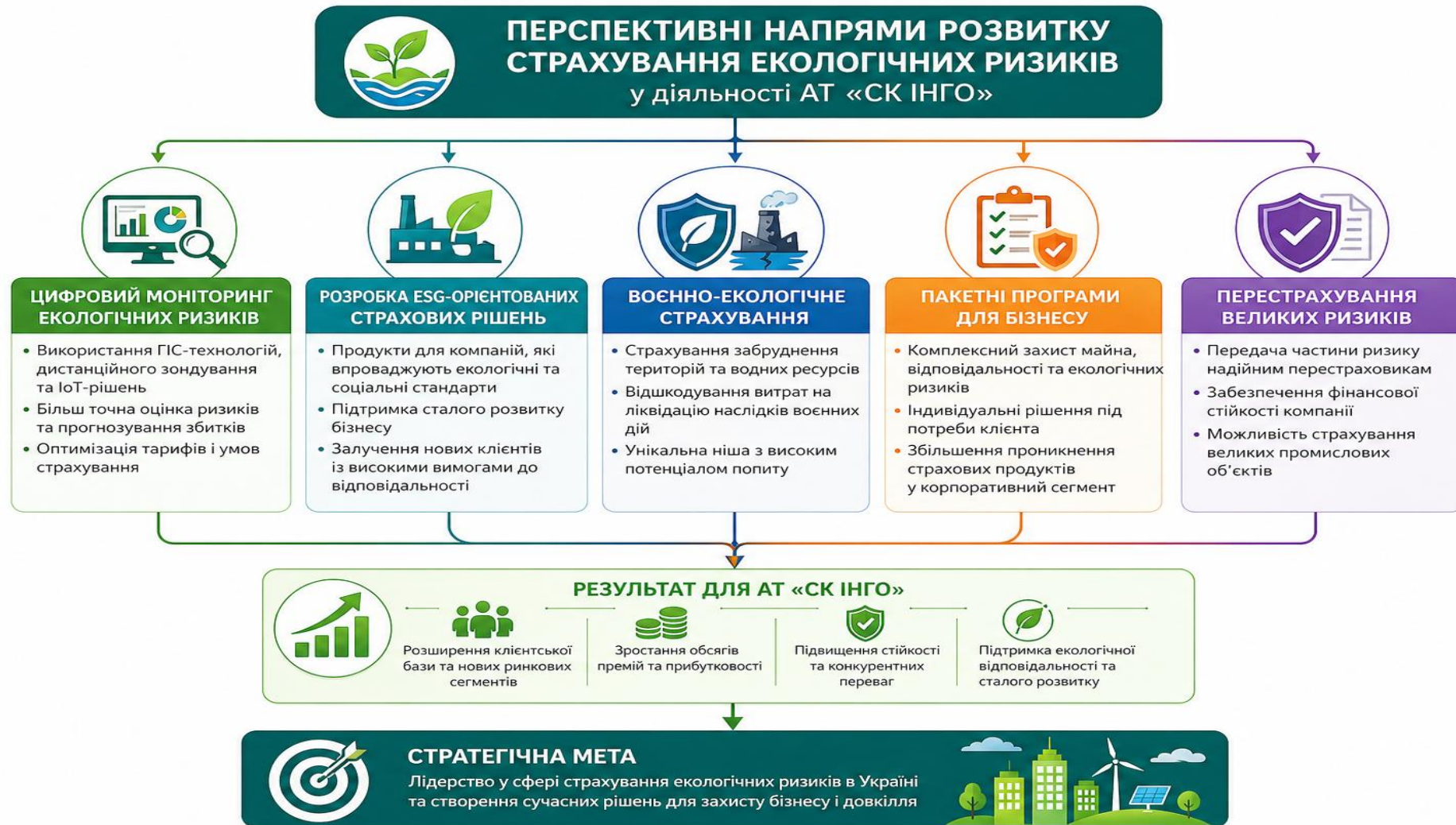
Рис. 2.2. Перспективні напрями розвитку страхування екологічних ризиків у діяльності АТ «СК ІНГО»