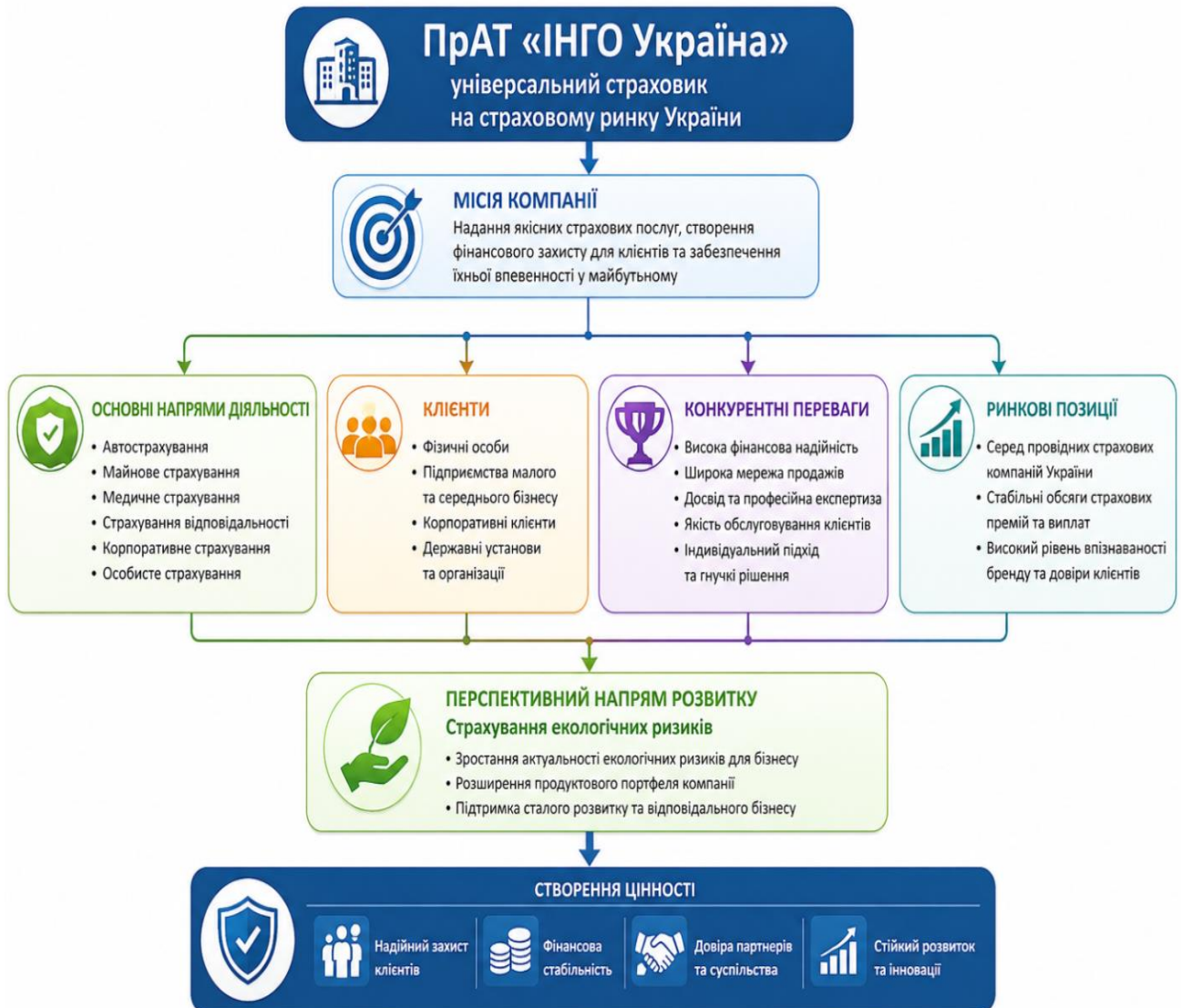
Рис. 2.1. Позиціонування ПрАТ «ІНГО Україна» на страховому ринку та перспективи розвитку

клієнтів компанії поява нових страхових продуктів означає доступ до сучасних інструментів захисту від екологічних загроз (рис. 2.1).