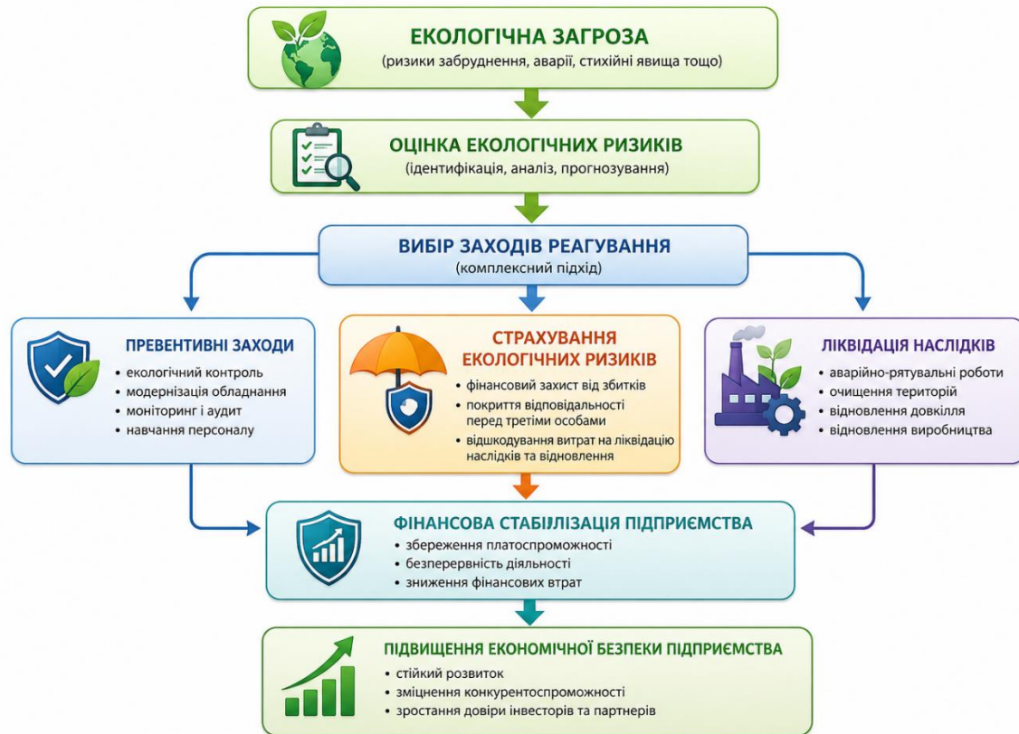
Рис. 1.1. Місце страхування екологічних ризиків у системі економічної безпеки підприємства