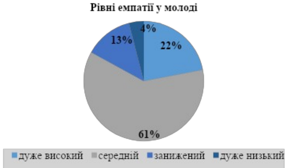
Рис.1. Графічне зображення рівнів емпатії серед молоді

Згідно з отриманими даними 22% опитаних виявили дуже високий рівень розвитку емпатії. Для цієї групи характерна виражена міжособистісна чутливість, щирий інтерес до внутрішнього світу партнера по спілкуванню та висока здатність до адекватного емоційного резонансу. Такі респонденти глибоко усвідомлюють переживання інших, що є фундаментальною основою для стабільної волонтерської активності.