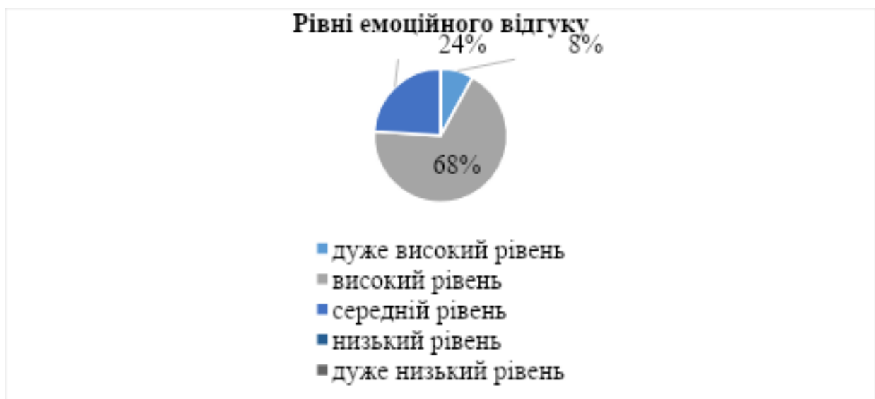
Рис.3. Графічне зображення рівнів емоційного відгуку

Дослідження здатності до емоційного резонансу за методикою А. Меграбяна та Н. Епштейна дозволило поглибити розуміння афективного компонента емпатії у студентської молоді. На відміну від методики В. Бойка, дана шкала фіксує не лише канали сприйняття, а загальну інтенсивність реагування на стан іншого. Згідно з результатами, представленими на рисунку 3, показники емоційного відгуку розподілилися наступним чином.