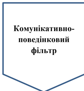
Рис.1.1. авторська теоретична модель « Перцептивна лійка»

Первинний фільтр візуально-естетичної відповідності характеризується тим, що на ньому спрацьовують архаїчні механізми, а саме естетична тривога. Психіка миттєво фіксує «порушення цілісності» тіла. Раніше цей фільтр викликав лише відторгнення. Зараз в Україні відбувається «нормалізація залізного тіла». Протез перестає сприйматися як «чужорідний об'єкт» і стає ознакою приналежності до сучасної української реальності. Виникає феномен «естетики сили», де функціональний протез сприймається як символ технологічної переваги та волі.