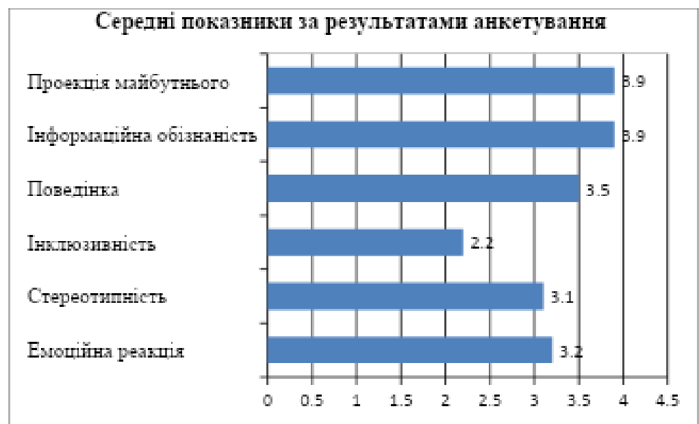
Рис.2.1. Результати анкетування

Аналіз середніх показників за основними детермінантами соціальної перцепції виявив низку закономірностей, що відображають стан сучасної української суспільної свідомості. Відповіді досліджуваних на запитання анкети дають можливість робити наступні висновки (Рис.2.1.)