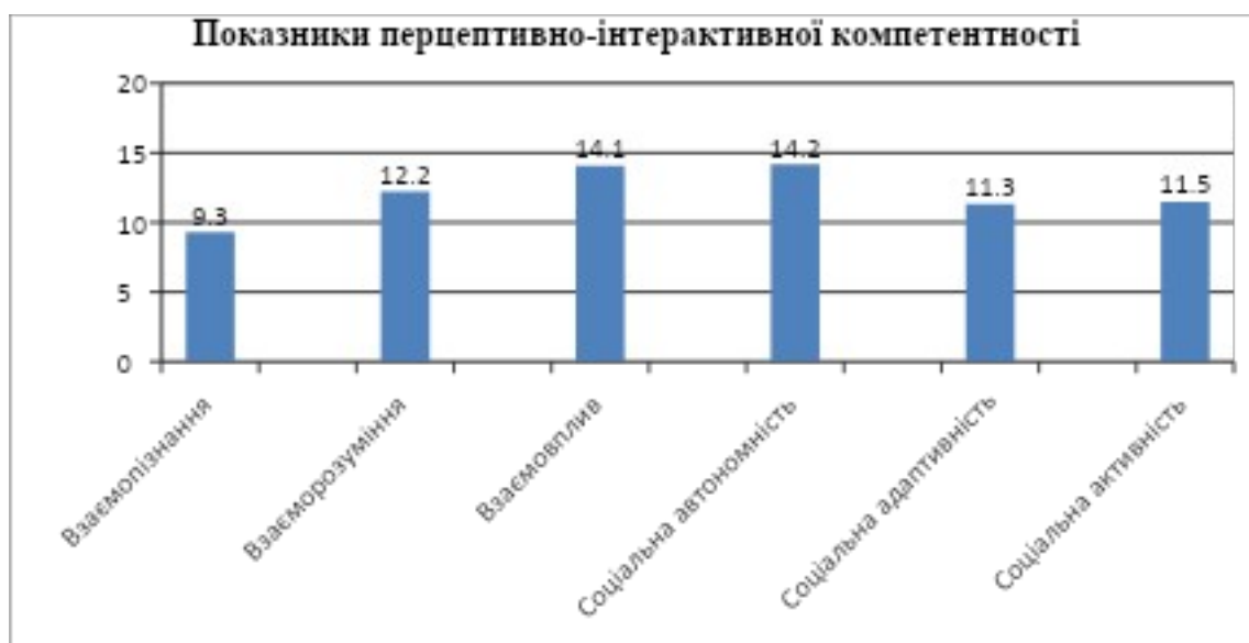
Рис.2.4. Показники перцептивно-комунікативної компетентності

Нами було також визначено особливості перцептивно-інтерактивної компетентності досліджуваних, адже від їхнього рівня залежить сприймання осіб з ампутаціями. У результаті опрацювання результатів отримано такі показники (Рис.2.3.)