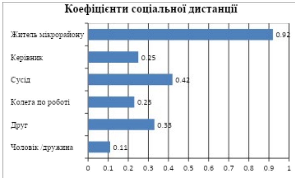
Рис 2.2. Коефіцієнти соціальної дистанції

За результатами методики на визначення соціальної дистанції отримано наступні показники (Рис.2.2.)