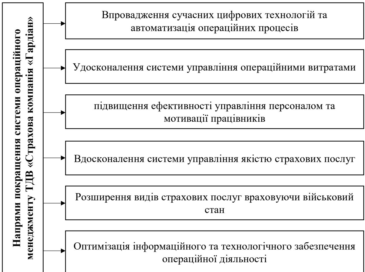
Рис. 3.1. Напрями покращення системи операційного менеджменту ТДВ «Страхова компанія «Гардіан»

Основними напрямками вдосконалення системи операційного менеджменту ТДВ «Страхова компанія «Гардіан» на нашу думку повинні бути ті що подані на рисунку 3.1.