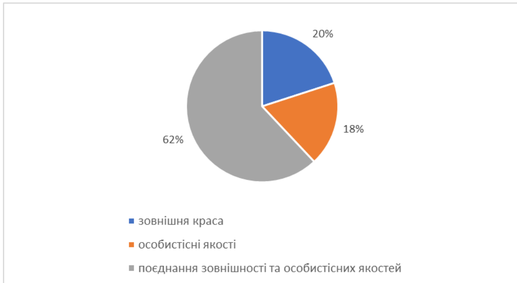
Рис.2.2. Відповідь на питання «Що, на Вашу думку, є більш важливим для виникнення симпатії?» серед досліджуваних чоловіків (n=50)

Згідно отриманих даних, можемо зробити висновок, що більша частина досліджуваних чоловіків (62% опитаних) схильється до думки, що у виникненні симпатії рівноцінно важливими є і зовнішня привабливість, і особистісні якості. Тоді як лише зовнішню привабливість як фактор міжособистісної атракції сприймають 20% досліджуваних, а лише особистісні якості - 18% досліджуваних чоловіків.